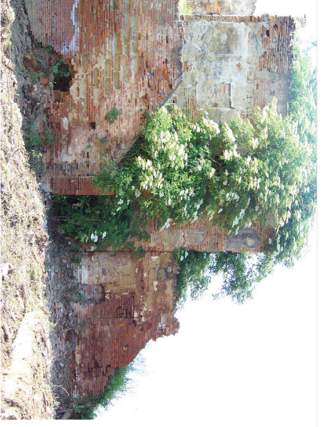
CORPO A - Documentazione fotografica - stato 2010 - vista dall'esterno